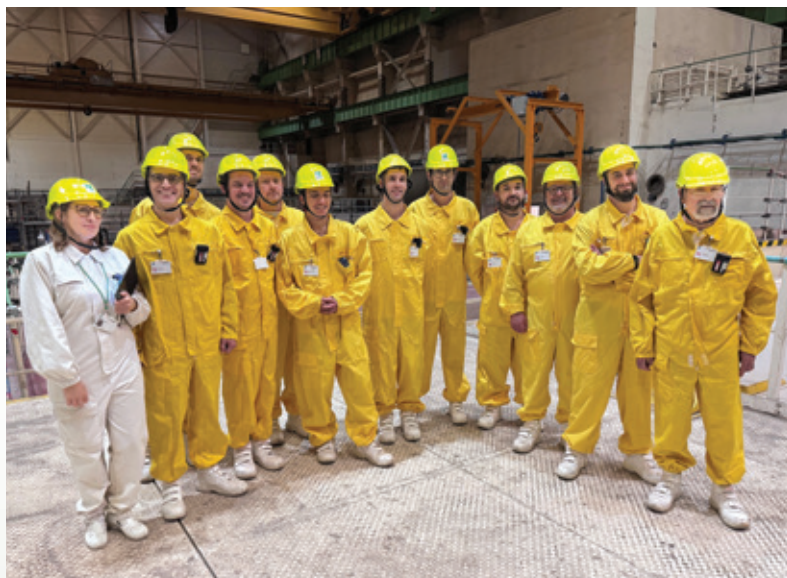
Účastníci seminára na reaktorovej sále JE V1.

V prvý deň workshopu sa pozornosť účastníkov sústredila na palivový cyklus a bilanciú plutónia, ktoré patria medzi kľúčové témy konceptu LFR. Diskutované boli rôzne scenáre uzavretého palivového cyklu LFR. Osobitná pozornosť sa venovala predpokladanému času potrebnému na prepracovanie paliva, odhadu potrebného množstva jadrového materiálu, jeho kvalitatívnym a kvantitatívnym charakteristikám a jeho možnému vplyvu na celý palivový cyklus.