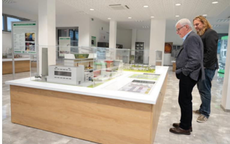
V informačnom centre JE A1 pri modeli areálu elektrárne.