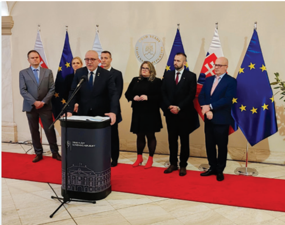
Tlačová konferencia na Úrade vlády SR po schválení Akčného plánu podpory vzdelávania, výskumu a prípravy ľudských zdrojov v jadrovom odvetví.