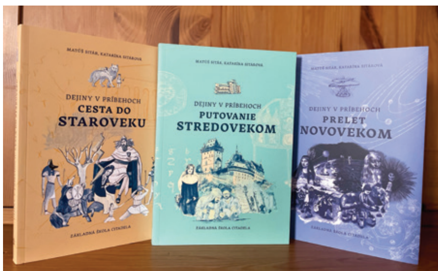
Dejiny v príbehoch

Texty najprv písal iba manžel. Každý týž-