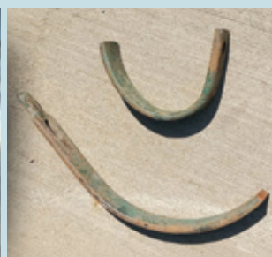
Súčiastka poľnohospodárskej techniky