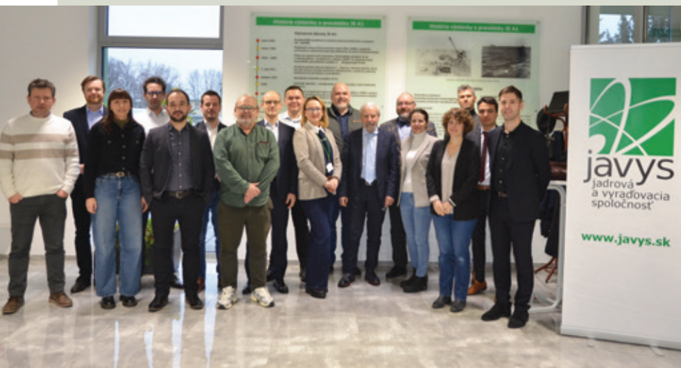
Účastníci seminára v Informačnom centre JE A1.