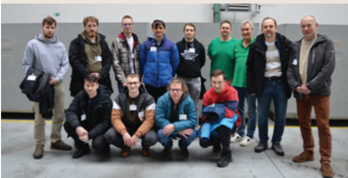
Prezreli si výrobu vláknobetónových kontajnerov.

Text a foto: Mgr. Jana Čápková , koordinátorka komunikácie