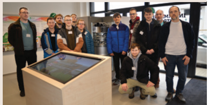
Navštívili informačné centrum RÚ RAO v Mochovciach.