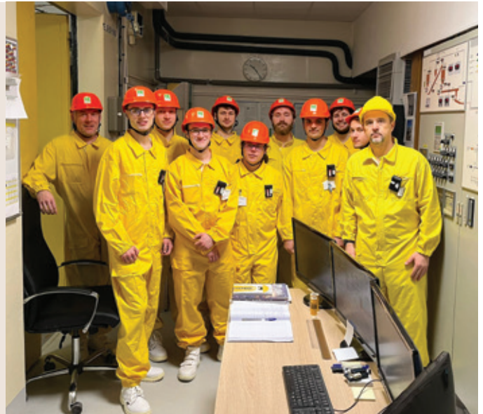
Študenti navštívili Bohunické spracovateľské centrum rádioaktívnych odpadov.

Jeden zo študentov vyzdvihol reaktorovú sálu a priestory pod reaktorom, pretože možnosť vidieť priestory bez technológie mu umožnila